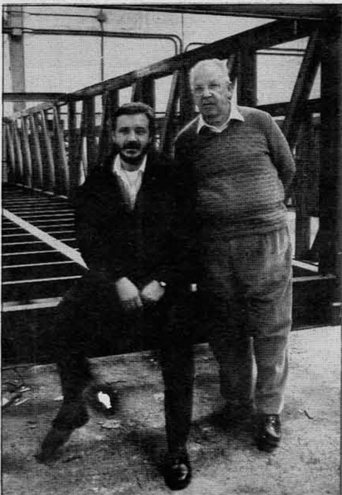
Las necesidades del transporte han llevado a S.C.L.L. a especializarse en la fabricación de grandes containers. Ahora mismo está realizando un importante encargo para un prestigioso transportista isleño

Polígono Industrial La Victoria PALMA DE MALLORCA